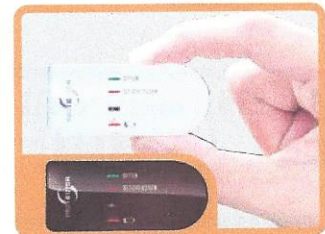
FENSTER SENDEERGEHÄUSE ZUSÄTZLICH IN BRAUN BEIGEFÜGT